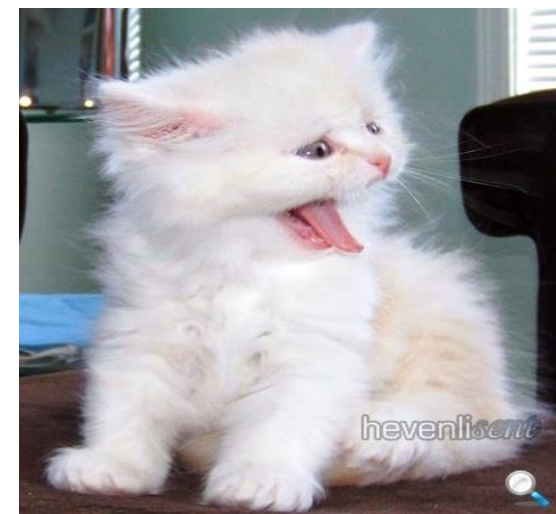
Гимнастика после сна

б) “Котенок ласковый”. И. п.: стоя на четвереньках. В.: голову вверх, спину прогнуть, повилить хвостом.