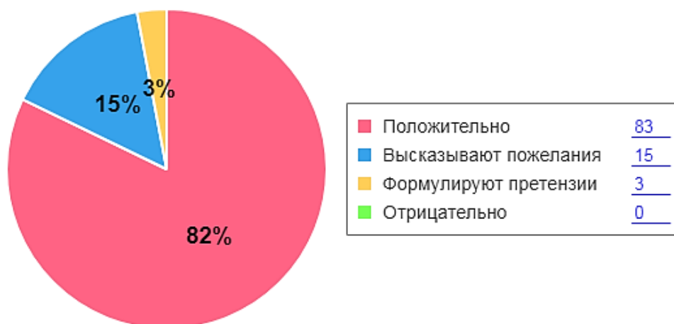
Как родители оценивают детский сад

В 2022 году родители приняли участие в совместных мероприятиях с детьми: выставки - галереи «Осенние фантазии», «Вместе с папой...», «Защитникам Родины», «Улыбайтесь с нами», «Высоко, к звёздам», акция по сбору семян «Трудовой десант», акция «Книга на память», акция- изготовление новогодних украшений «Нарядим елку вместе», тематическая выставка «Дари добро!»; групповые тематические родительские собрания «Формирование связной речи детей дошкольного возраста», «Наши достижения», «Планирование работы на новый учебный год», «Формирование у дошкольников навыков безопасного поведения через раннюю профориентацию», встречи с родителями «В детский сад без слез!» (группы раннего возраста) и др. Проведен опрос «Анкета для опроса